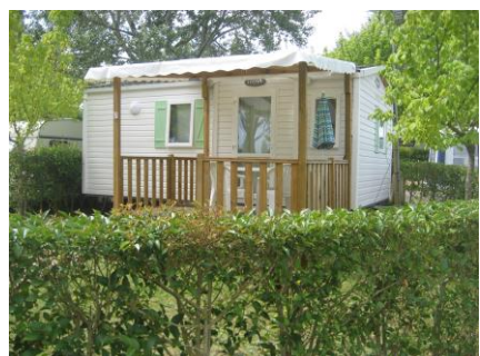
superficie de 24 m 2 - de 2008 à 2009

1 table de jardin 4 chaises de jardin terrasse semi-couverte (n°51-67-30-42) kiosque couvert non attenant pour le n°16 1 parasol et son pied